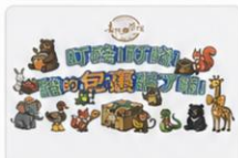
2 遊戲圖 ×1張(僅供示意)