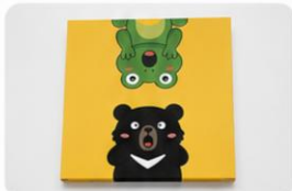
5 任務卡 ×18張