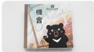
6 機會卡 ×36張(僅供示意)