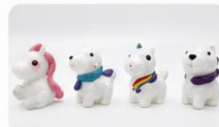
4 棋子 ×4顆